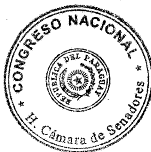
Fernando Lugo Méndez Presidente H. Cámara de Senadores